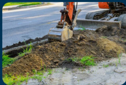
Ref : AIPR02